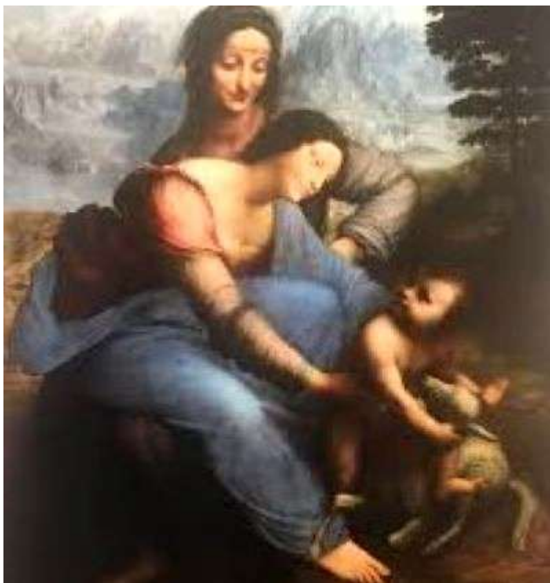
A Virgem, o Menino e Santa

Nos séculos seguintes a veneração à Santa expandiu-se também pela Europa. Em 1503, Leonardo da Vinci pintou o quadro “A Virgem, o Menino e a Santa Ana”. A obra encontra-se no Museu do Louvre, em Paris.