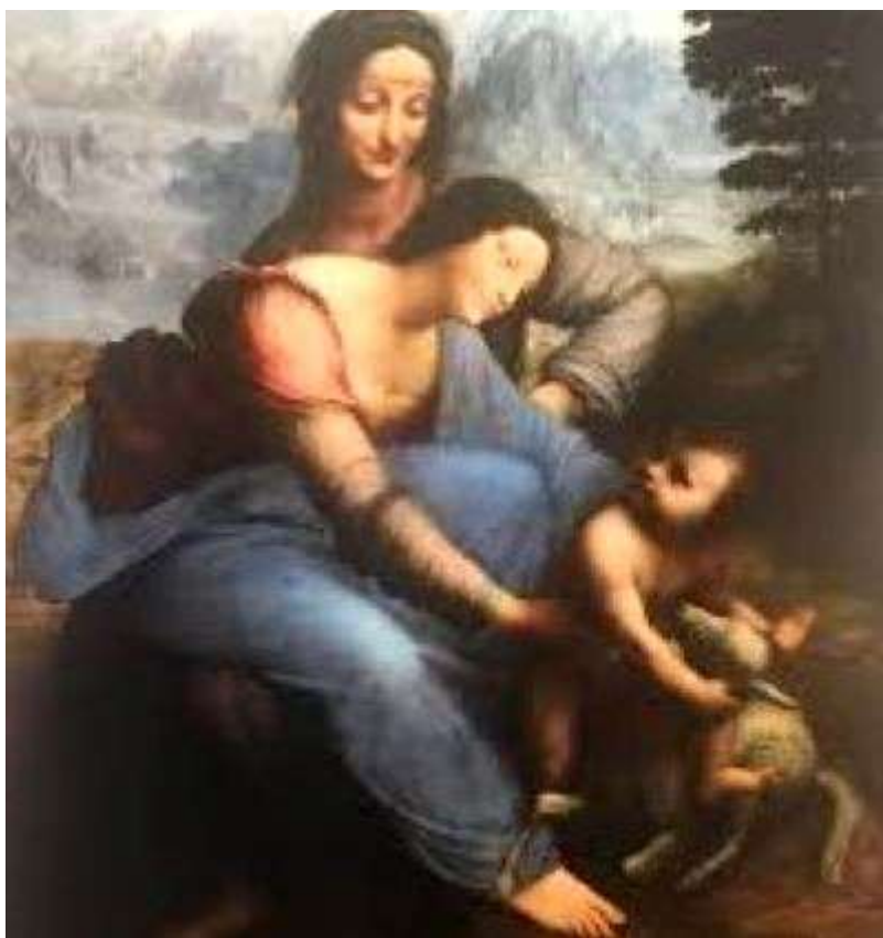
A Virgem, o Menino e Santa Ana

Nos séculos seguintes a veneração à Santa expandiu-se também pela Europa. Em 1503, Leonardo da Vinci pintou o quadro “A Virgem, o Menino e a Santa Ana”. A obra encontra-se no Museu do Louvre, em Paris.